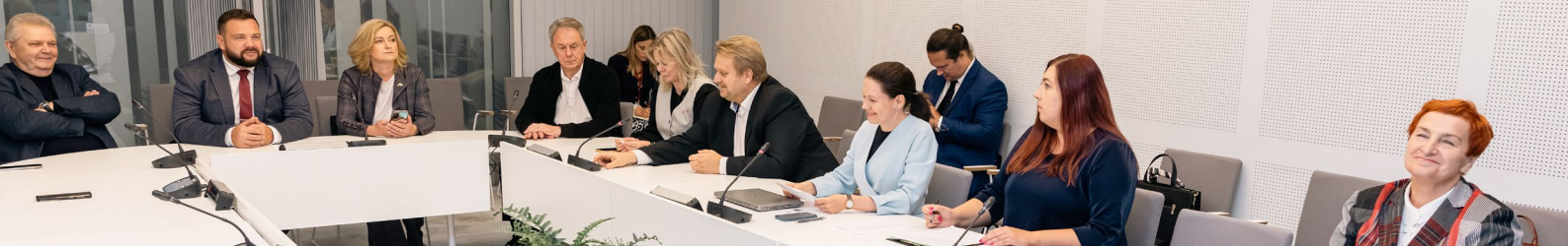
■ Saeimas Publisko izdevumu un revīzijas komisijas sēde